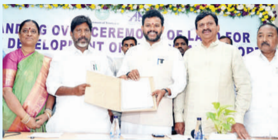
వరంగల్ విమానాశ్రయంపై ముందడుగు!