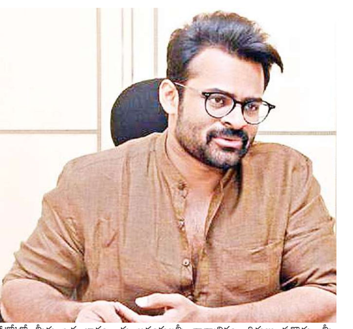
ఫోటోలో మీరు ఒక భాగం. ఈ అడ్డంకులన్నీ తాత్కాలికం. దిగులు పడొద్దు. మీ కష్టాన్ని ప్రేక్షకులు గుర్తిస్తారు, మద్దతు ఇస్తారు. ఆల్ ది బెస్ట్' అని విషెస్ చెప్పాల్సి ఉంది.

అఖండ 2 విడుదలకు హైకోర్టు గ్రీన్ సిగ్నల్.. ప్రస్తుతం టాలీవుడ్ ఇండస్ట్రీలో మోస్ట్ అన్టెటెడ్ సినిమాల్లో 2 ఒకటి. భారీ అంచనాల మధ్య రూపొందించిన ఈ సినిమా విడుదల కోసం నందమూరి ఫ్యాన్స్ ఎంతో ఆసక్తిగా ఎదురుచూస్తున్నారు. నందమూరి బాలకృష్ణ హీరో డైరెక్టర్ బోయపాటి శ్రీను ఈ మూవీని రూపొందించారు. ఇప్పటికే విడుదలైన టీజర్, ట్రైలర్ సినిమాపై మరింత హైట్ క్రియేట్ చేశాయి. ఇందులో బాలయ్య, నట విశ్వరూపం చూపించనున్నారని ముందు నుంచి పోస్టర్స్, టీజర్ పై బజ్ క్రియేట్ చేశారు మేకర్స్. డిసెంబర్ 5న ఈ సినిమా విడుదల కావాలి, ఉంది. అప్పటికే బాలయ్యతోపాటు చిత్రయూనిట్ సైతం జోరుగా ప్రమోషన్స్ నిర్వహించారు. కానీ చివరి క్షణంలో ఈ సినిమా విడుదలకు వాయిదా వేశారు. పైసాన్నియల్ వివాదాల కారణంగా ఈ సినిమా