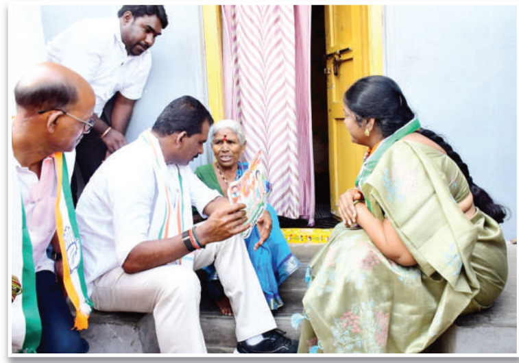
వనపర్తి ప్రతినిధి, (నేటి ఫోకస్ న్యూస్)-ఫిబ్రవరి 4:

• కాంగ్రెస్ తోనే అభివృద్ధి సాధ్యం • మరో ఎనిమిదేళ్లు కాంగ్రెస్ ప్రభుత్వమే ఉంటుంది • 33, 24 వార్డుల్లో మార్పింగ్ వాక్ చేసిన ఎమ్మెల్యే మేఘారెడ్డి