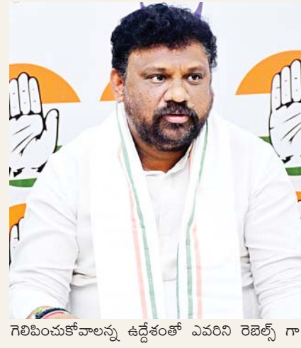
గెలిపించుకోవాలన్న ఉద్దేశంతో ఎవరిని రెజెల్స్ గా