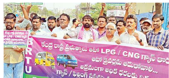
ఎల్పీజీ--సీఎన్జీ కొరతతో కుదలేన ఆటో డ్రైవర్ల